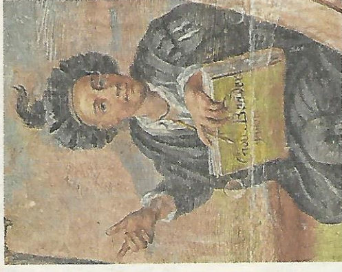
Ein Sonderteil der Geschichtsblätter widmet sich dem „Lechhansl“.